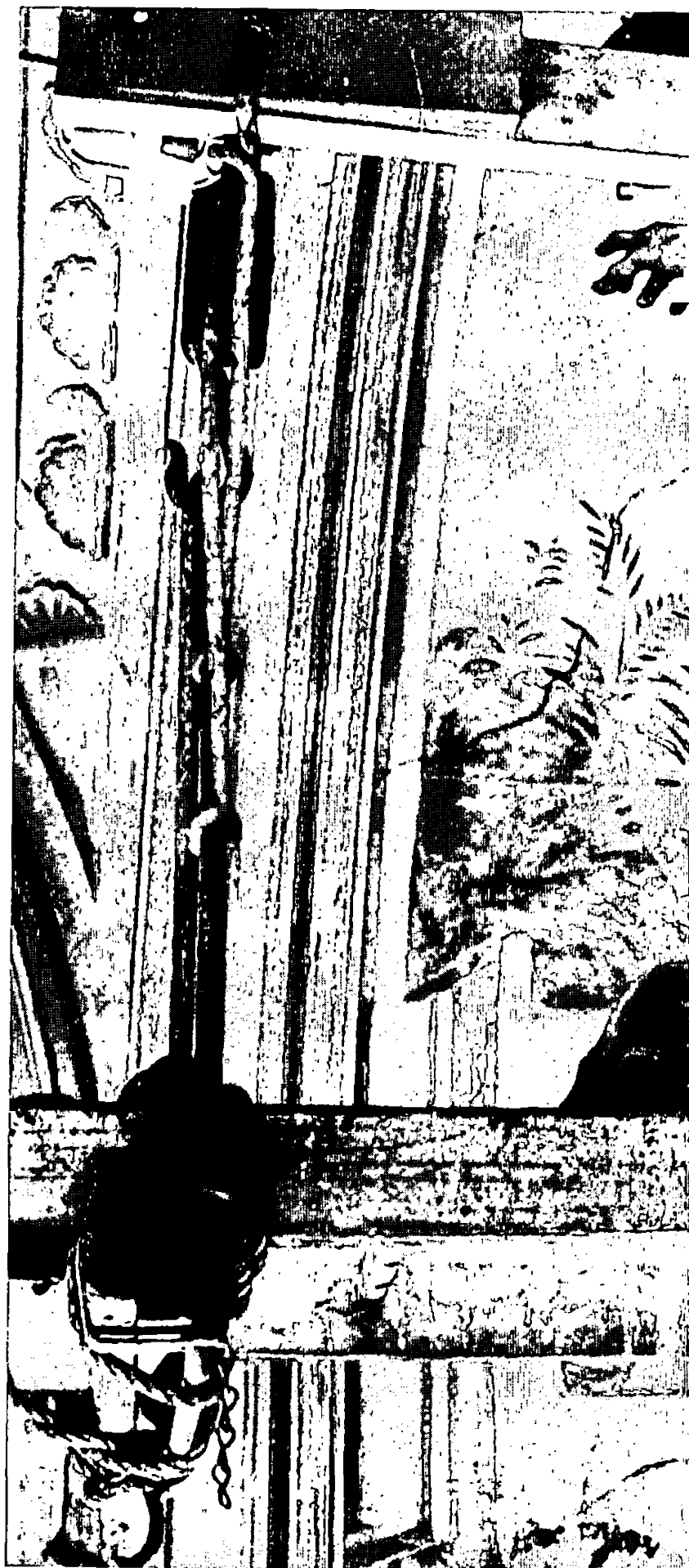
Mia Farrow dans « Rose- mary's Baby ».